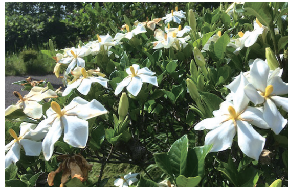
北庭をはじめ、敷地内の草花も魅力。 樹木の数も多く、公園として楽しむこともできます。 広瀬川や青葉山など周辺の自然とのつながりも魅力です