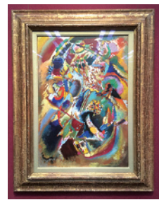
カンディンスキー作品