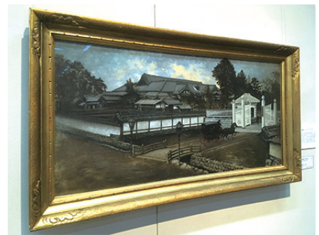
高橋由一による宮城県庁を描いた作品

さらに、各種の公演会など実施することによって、美術とそれにかかわる幅広い表現領域にまでおよぶ創造的な体験の場として、地域に根ざした、開かれた美術館をめざしています。