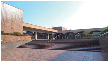
福岡市美術館 1979年オープン 2019年リニューアル