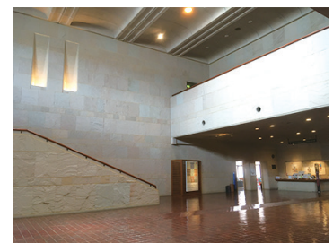
本館エントランス