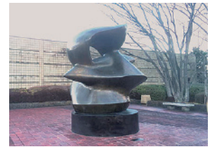
ヘンリー・ムーア 「スピンドル・ピース」