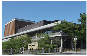
ロームシアター京都 1960年オープン 2016年リニューアル