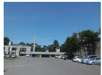
弘前市民会館 1964年オープン 2013年リニューアル

前川建築は日本のモダニズム建築の遺産として、改修して使い続ける例が増えています。上野の東京文化会館など首都圏はもちろん、地方でも青森県弘前市の市民会館や博物館、福岡市の美術館、熊本県立劇場など、全国各地で大切にされています。熊本県立劇場は、2076年まで現在の建物を使う計画が立案されています。