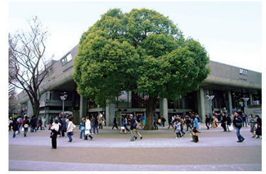
東京文化会館 1961年オープン 2014年リニューアル

http://www.city.hirosaki.aomori.jp/jouhou/keikaku/matn.html