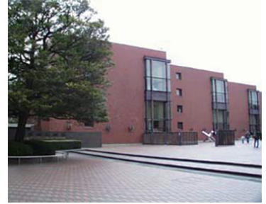
東京都美術館 1975年オープン 2012年リニューアル