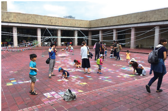
囲われた中庭では展示やワークショップなども開催。 柱が並び、タイルで覆われた魅力的なスペースです。