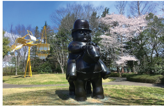
北庭には、ボテロや新宮晋などの彫刻を設置。 四季折々の植物とのコラボレーションを楽しめます