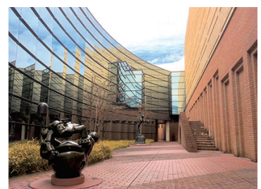
アリスの庭 彫刻が配された散策路