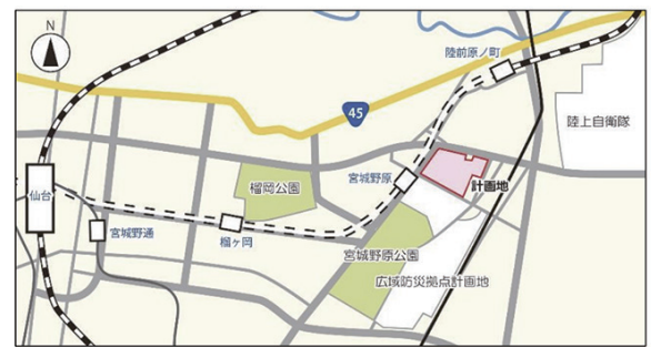
計画地地図 ※ピンク部分（仙台医療センター跡地）

このメニューを選択する場合、「統合前の施設の廃止が、集約化又は複合化による統合後の施設の供用開始から5年以内に行われることが必要。」※となっており、 現在の宮城県美術館の建物を解体や売却して「廃止」しなければ補助金が支払われないというルールになっています。