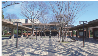
熊本県立劇場 1983年オープン 2021年改修工事