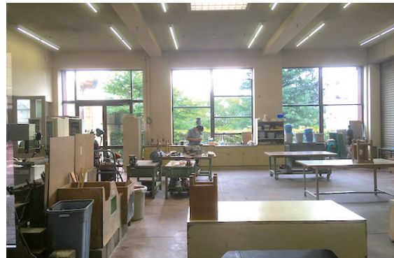
創作室。溶接までできる設備は全国的にも珍しい。 来館者だれでも創作ができ、スタッフに相談も可能。 教育普及を大きなテーマとしてきた宮城県美の象徴です