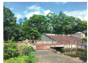
北庭 広瀬川河畔に位置している