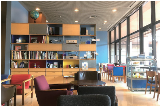
カフェは仙台のカフェモーツァルトが運営。 バウハウス調の家具と、展覧会に合わせたメニューが人気