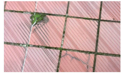
タイルの割れもあるが補修可能

県は、美術館の老朽化を移転理由のひとつに挙げていますが、設計に携わった建築家の大宇根弘司氏によれば、あと最低でも50年は使えるそうです。