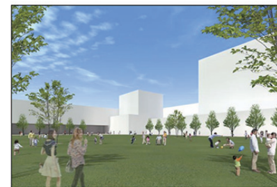
図7 施設配置イメージ（施設配置例①において敷地の南から北を臨む）※