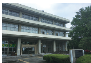
みやぎ NPO プラザ